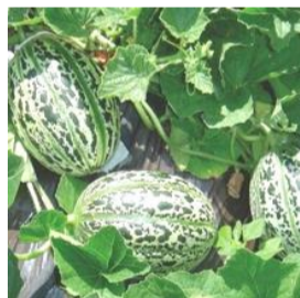
N°106 Melon Lunéville

Résistante au froid et à l'humidité . Produit des fruits ronds ou ovales de couleur vert pâle tacheté de vert foncé, pouvant dépasser 2kg. Chair orange, juteuse, ferme et savoureuse .