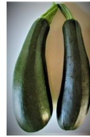
N°103 Courgette Zuboda

Buissonnante et précoce . Supporte bien le froid en arrière-saison. Fruit long, vert légèrement marbré, savoureux. De bonne conservation . Récolte après 6 semaines.