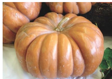
N°102 Courge Moschata Musquée de Provence

Ancienne variété, aux côtes bien marquées, tardive et coureuse . 4 à 7 fruits par pied. Partie cylindrique de 8 à 50 cm de diamètre, pesant de 1.5 à 50 kg. Peau du vert à l'ocre. Chair exquise beurrée, sucrée et fondante . Se conserve 4 à 9 mois.