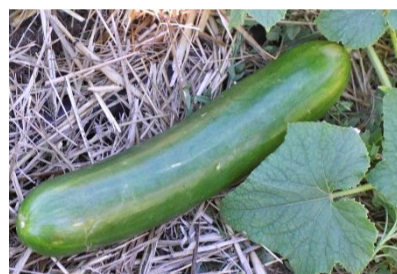
N°109 Concombre Le Généreux

Variété ancienne, mi-hâtive, rustique et productive. Fruits cueillis jeunes utilisés comme cornichons . Saveur douce , sans amertume. Fruits cylindriques demi-longs, ~25 cm. Peau lisse verte.