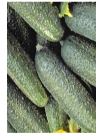
N°111 Cornichon Fin de Meaux

Ancienne variété. Abondance de fruits verts, longs et cylindriques. Très facile à cultiver et présente une croissance vigoureuse .