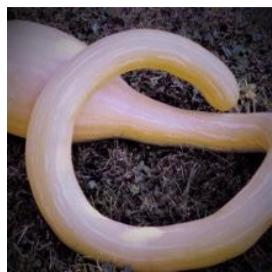
N°100 Courge Moschata Tromba d'Albenga

Variété ancienne . 4 à 6 fruits cylindrique très courbés par plant, jusqu'à 1,50 m et 4 kg . Un an de conservation. Épiderme vert clair, puis ocre à maturité. Chair orange clair fine et délicieuse .