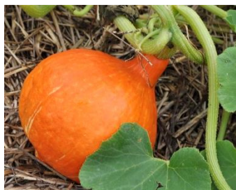
N°101 Courge Maxima Potimarron Red Kury

Chaque plant produit plusieurs fruits rouges pouvant atteindre 2 kg , en forme de toupe . Chair orange et sucrée à goût de châtaigne . Pas nécessaire de peler ce fruit. Récolte : juillet à novembre.