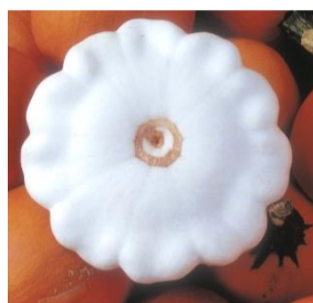
N°105 Pâtisson Blanc

Non coureuse . Produit de nombreux fruits ronds et plats, de 12 à 25 cm de diamètre. Chair blanche, ferme, peu sucrée avec un léger goût d'artichaut . Récoltez et consommez le fruit jeune.