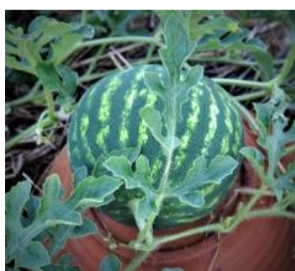
N°113 Pastèque Quetzali

Variété américaine adaptée aux climats frais . Petits fruits ronds de 4-5kg. Épiderme épais. Chair rouge vif particulièrement sucrée . Bien arroser pendant tout le développement.