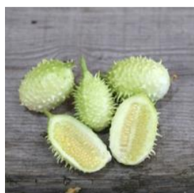
N°112 Concombre des Antilles

Chair douce et sans amertume . Consommation crue en vinaigrette ou cuit à la poêle avec du beurre ou de l'huile, tomates, oignons, ail, bouquets garnis. A consommer jeune.