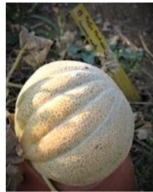
N°107 Melon Montréal

Ancienne variété, de type «Cantaloup». Fruit rond à la peau brodée qui peut peser jusqu'à 6 kg. Chair orangée, juteuse et très sucrée .