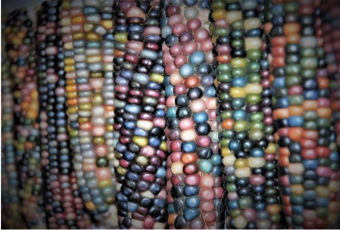
Mais à farine de la nation Cherokee « Glass Gem » cultivé à Bretonnières.

Les efforts pour la préservation et la diffusion de variétés de fruits et légumes (naturelles, anciennes ou locales) sont plus nécessaires que jamais . Elles seules sont adaptées ou adaptables aux conditions locales, et capables de garantir une teneur réelle en éléments nutritifs. Elles sont riches de goût et sont susceptibles d'être reproduites. C'est donc la base de notre sécurité alimentaire.