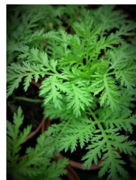
Artemisia annua de notre production.