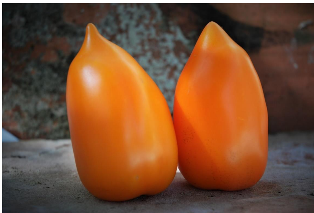
Tomate jaune « Cornue des Andes » riche en lycopène et vitamines, sans acidité !

Nous cherchons aussi à poursuivre une réflexion autour de la notion de « ResSources de vie » ainsi que des principes qui permettent de les gérer de manière résiliente, locale et solidaire. Cette approche constitue de notre point de vue l'outil principal pour être à la hauteur des défis actuels. La crise que traverse notre monde montre l'urgence d'intensifier notre action de conservation et de production de semences et notre présence auprès du public. C'est ce que nous faisons.