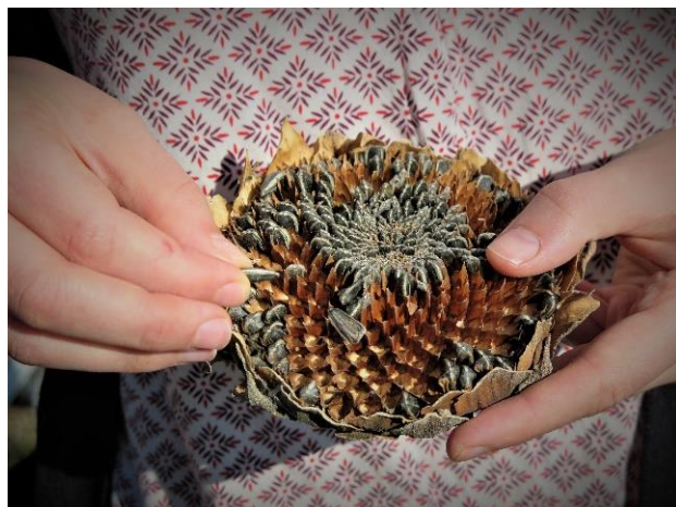
Un patrimoine à transmettre...

Nous pensons nécessaire de continuer notre action maintenant, tant que cela est encore possible, pour protéger notre patrimoine vivant, afin de le transmettre aux générations futures. Depuis 2009 notre équipe travaille à la préservation et au maintien de cette biodiversité cultivée, maraîchère, agricole et médicinale, en prenant soin des semences naturelles et patrimoniales, par la conservation, la multiplication et la diffusion de ces ResSources de vie.